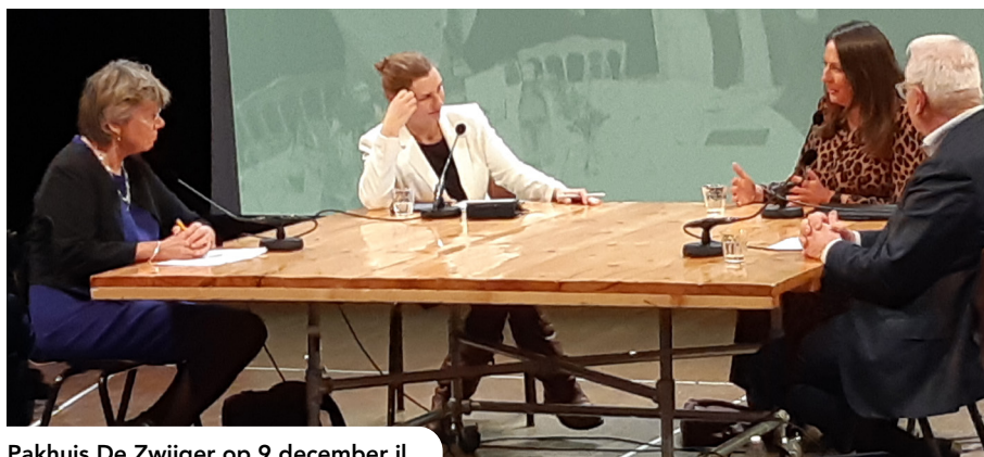
Pakhuis De Zwijger op 9 december jl.